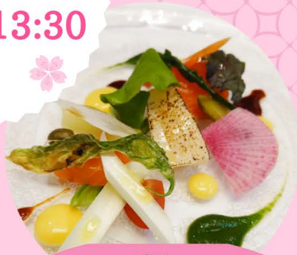
季節ランチ「春咲きランチ」※

当会女性部では、コロナ禍でお休みしていた恒例のひなまつりランチ会を4年ぶりにフレンチレストランにて開催することにいたしました。